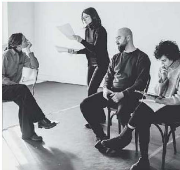
La compagnia Arti Fragili alle prese con "La questione di Penelope"